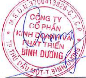
Quảng Văn Viết Cường Chủ tịch Hội đồng quản trị